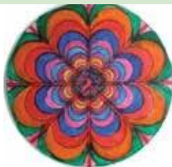
C. S. E. “Mandala”